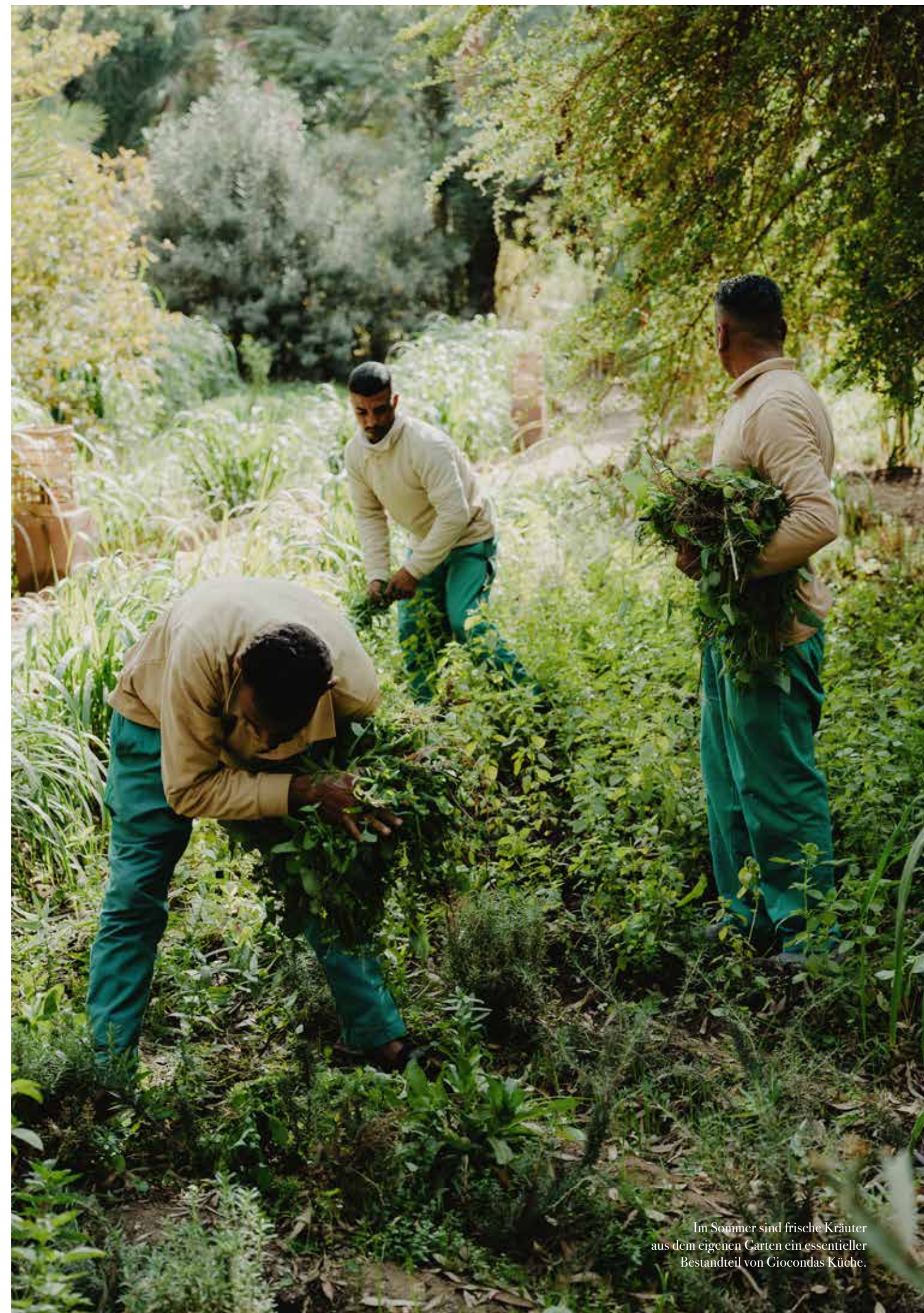
Im Sommer sind frische Kräuter aus dem eigenen Garten ein essentieller Bestandteil von Giocondas Küche.