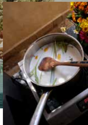
Lunch oder Abendessen genießt man im offenen Restaurant gleich neben der Farm, wo morgens die frischen Radieschen geerntet wurden. Der Lemongras-Reispudding, der auf dem Ofen vor sich hinköchelt, duftet nach Sonne.